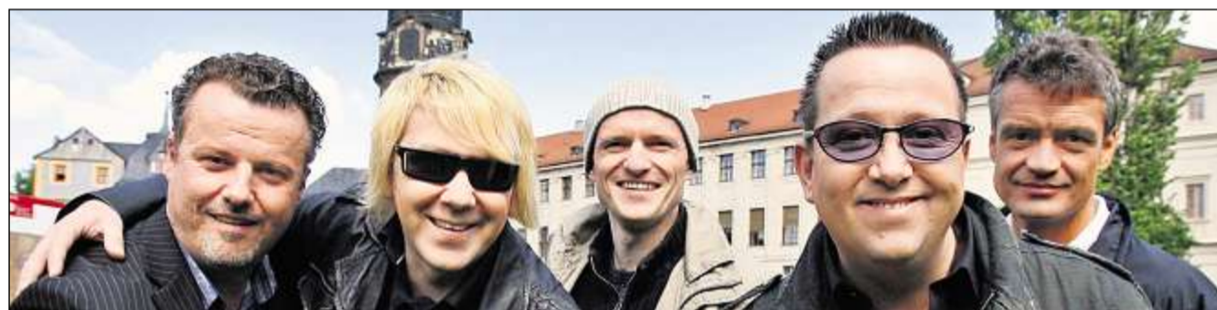
VON WEGEN ALLES NUR GEKLAUT: Die Leipziger Band „Die Prinzen“ gastiert auf ihrer Kirchentournee auch in Karlsruhe. Im September geben die Musiker ein Konzert in der renovierten Nordkirche in Neureut.